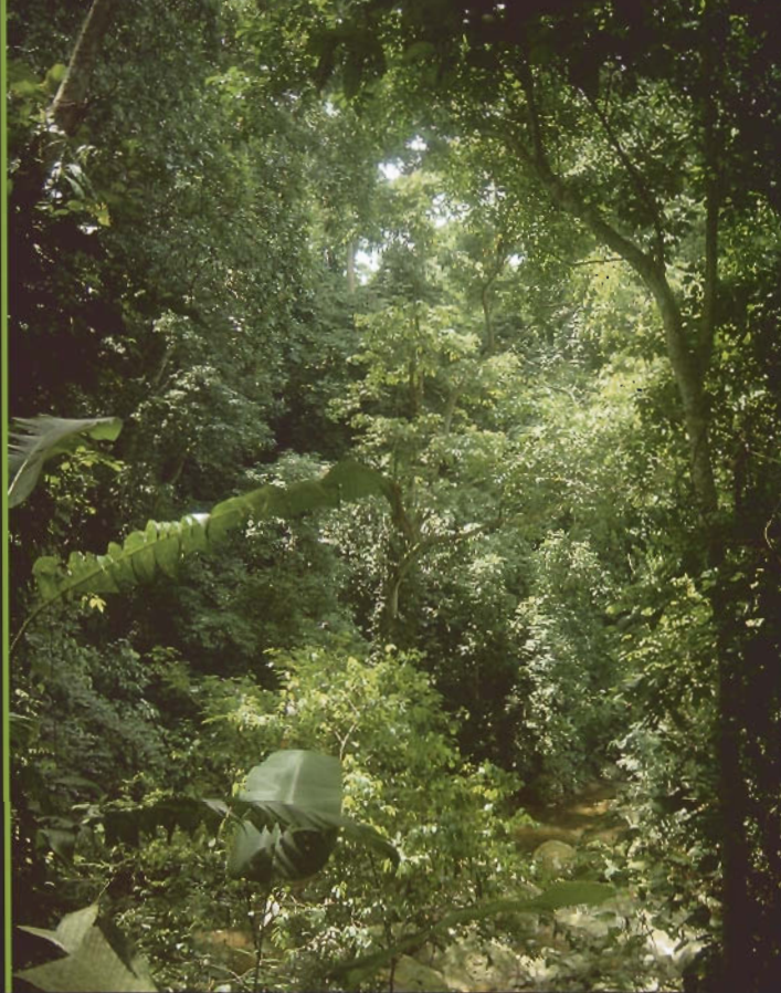
Selva húmeda submontana, cercanías de Caja Seca, Estado Mérida