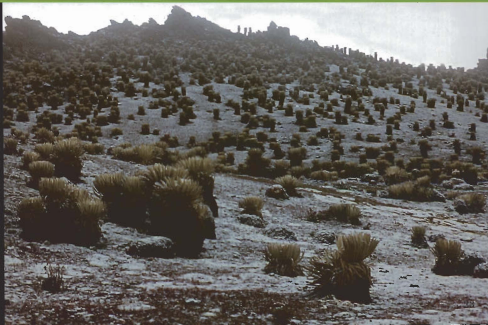
Páramo altiandino. Piedras Blancas, estado Mérida.

Debido a las condiciones extremas de temperatura, el páramo altiandino no es utilizado para actividades agrícolas. El uso de la tierra se restringe a un pastoreo muy extensivo de ganado vacuno y equino.