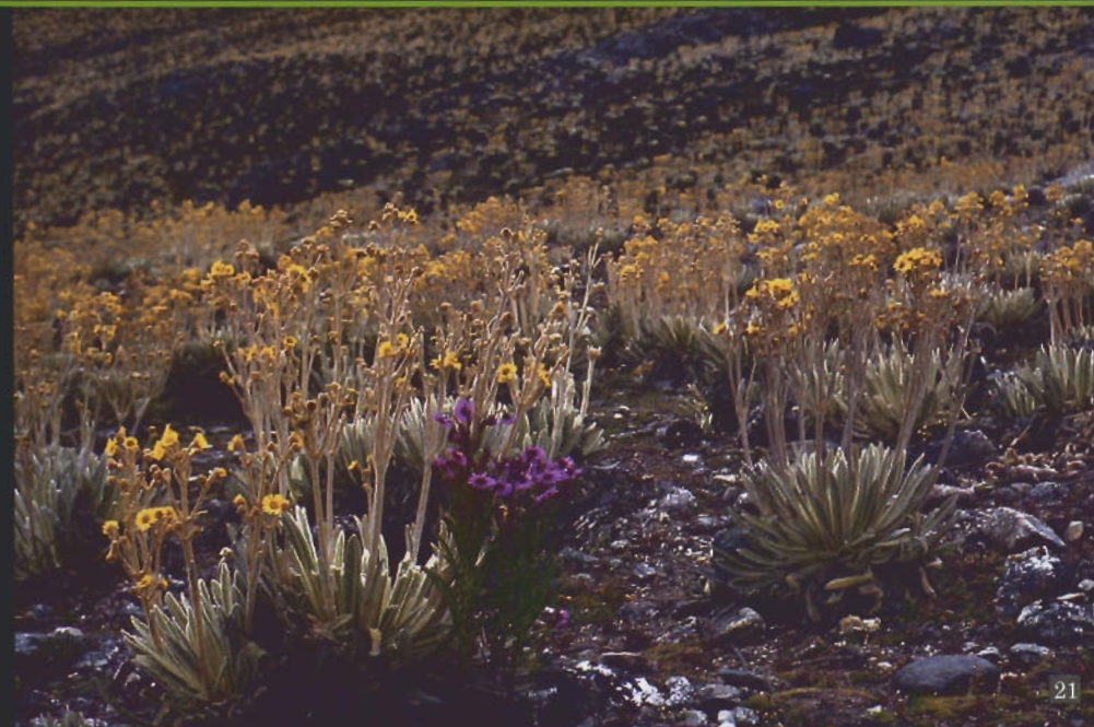
Páramo andino, cuenca alta del río Motatán, estado Mérida

La vegetación puede variar desde un rosetal casi puro, pasando por un rosetal-arbustal hasta llegar a un arbustal puro, dependiendo de la altitud, el drenaje y otros factores ambientales. El rosetal-arbustal es la formación