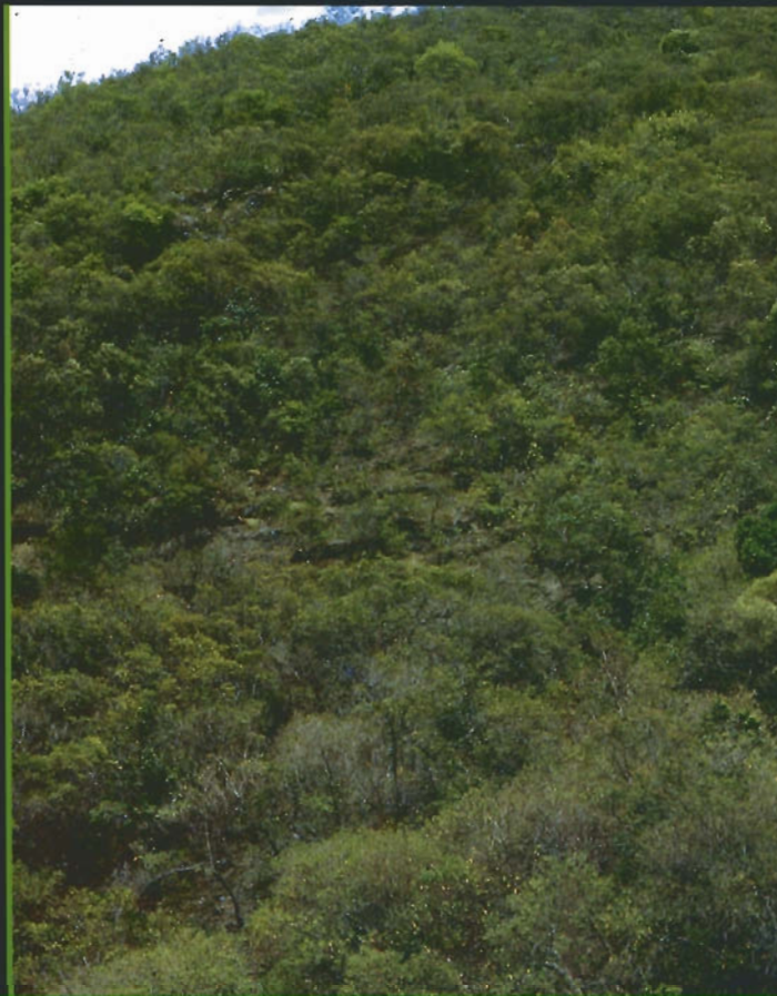
Bosque siempreverde seco, cuenca del río Mocotíes, estado Mérida

Ocupa ambientes relativamente frescos con bajas precipitaciones, con una distribución restringida a las zonas medias y altas de las vertientes secas. Puede distinguirse dos tipos: el bosque siempreverde seco montano bajo entre 1600 y 2000 m y el bosque siempreverde seco montano alto entre 2000 y 2700 m. Las precipitaciones anuales son bajas, entre 600 y 1100 mm para el tipo montano bajo y entre 500 a 900 mm para el tipo montano alto. Por sus bajas precipitaciones, así como por las temperaturas medias anuales entre 15 y 18°C en el tipo montano bajo, y entre 10 y 15°C en el tipo