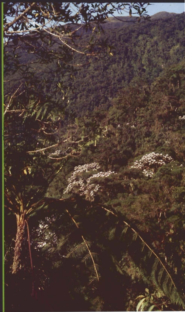
Selva nublada, cerca de El Zumbador, estado Táchira.

La selva nublada montano baja ha sido muy intervenida desde mediados del siglo XX y reemplazada por pastizales dedicados a la ganadería lechera de altura; no obstante, la selva nublada montano alta sigue siendo uno de los sistemas mejor conservados en cuanto a vegetación natural, situación que probablemente pueda prolongarse, en virtud de su buena representación en el Sistema Nacional de Áreas Bajo Régimen de Administración Especial.