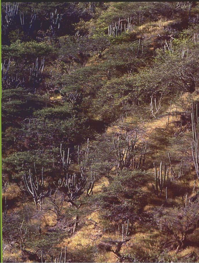
Arbustal espinoso, cuenca media del río Chama, estado Mérida

El arbustal espinoso ha sido sometido a una fuerte y prolongada intervención humana desde tiempos prehispánicos. En épocas recientes, la extracción de madera y el pastoreo por caprinos son la principal causa de degradación de la vegetación natural.